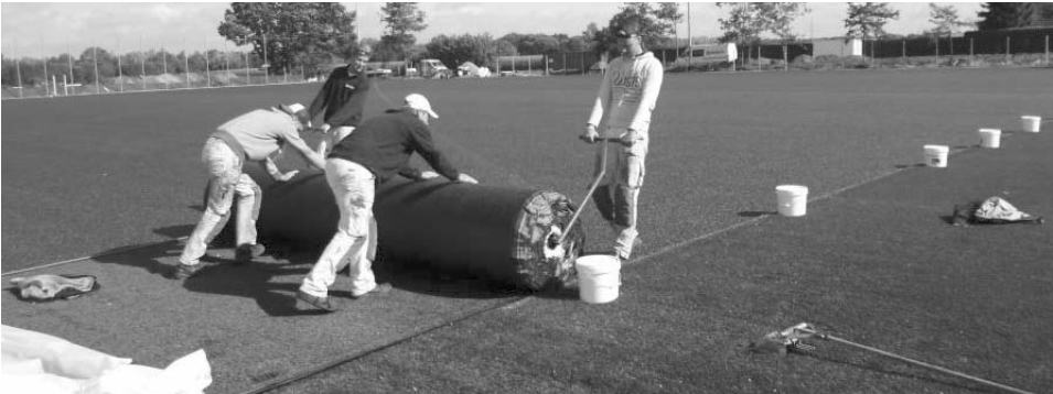
Mitte September wurden am Birkenbruch die Kunstrasenbahnen ausgerollt.