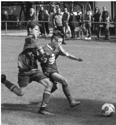
Die C1-Junioren wollen unbedingt in die A-Liga.