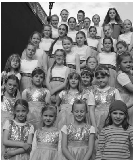
Die Gruppen Tinkerbelle und Dynamite stellten sich nach dem Auftritt zum Erinnerungsfoto auf.