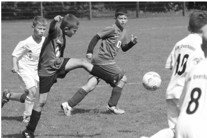
Die E-Junioren (dunkle Trikots) sind mit zwei Siegen furios in die Qualifikation gestartet.