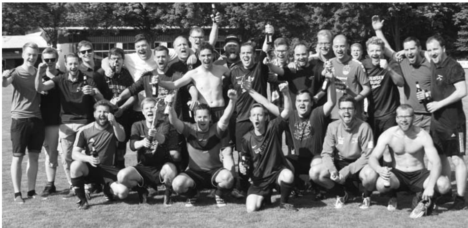
Der gesamte Kader der dritten Mannschaft feiert den historischen Aufstieg in die Kreisliga C.