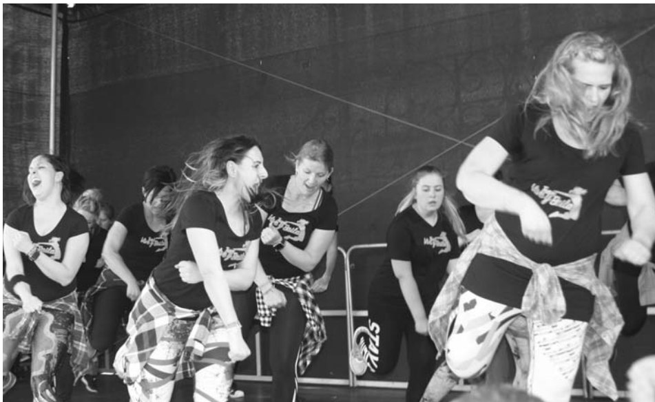
Die Bokwa- und Salsation-Gruppe riss die Zuschauer auf dem Rathausplatz mit.