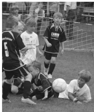
Kindergartenturnier immer beliebter ..... S. 21